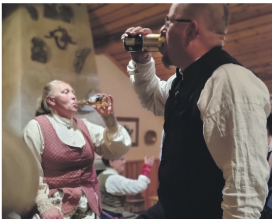
Humöret var på topp när förbänder från Sverige och Norge träffades i helgen.

Jämtland och även bland annat Härjedalen och Hälsingland. Resan tar en vecka.